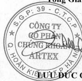
LƯU ĐỨC QUANG